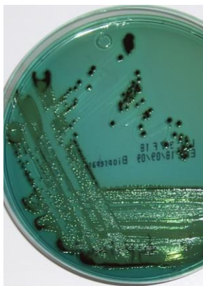
S. typhimurium ATCC 14028