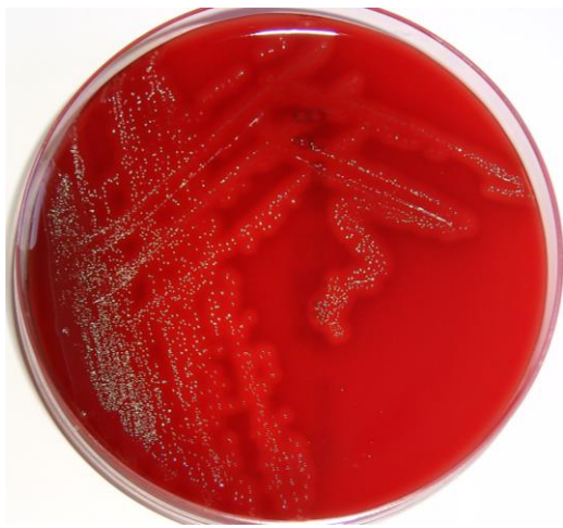
Streptococcus pyogenes ATCC 19615