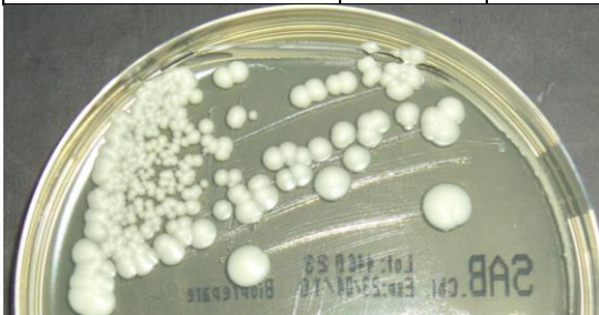
Candida albicans ATCC 10231