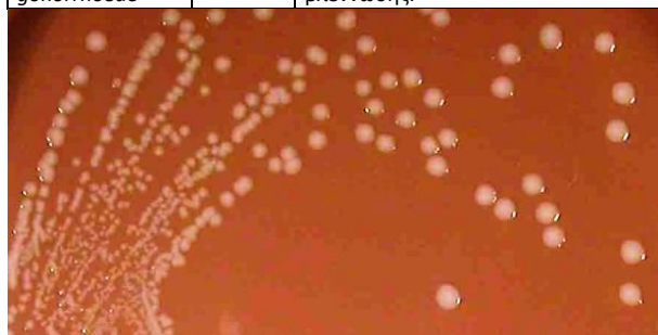
Haemophilus influenzae ATCC 10211