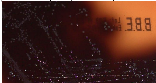
Bacteroides fragilis ATCC 25285