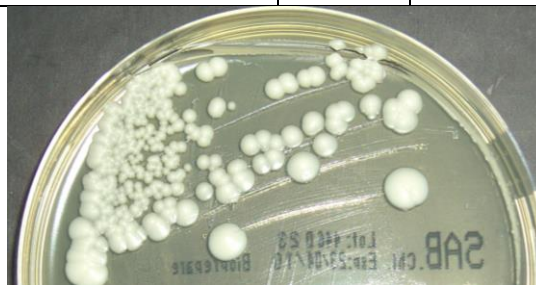
Candida albicans ATCC 10231