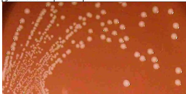
Haemophilus influenzae ATCC 10211