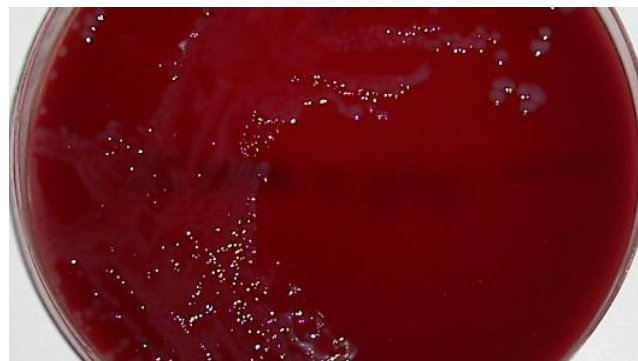
Bacteroides fragilis ATCC 25285